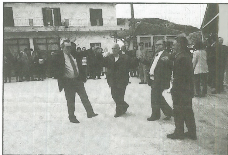
Το απόγευμα της Δευτέρας του Πάσχα, τα χορευτικά μας συγκροτήματα και πολλοί Καϊτσιώτες χόρευαν στην πλατεία του χωριού μας τον «Κλειστό χορό» και τον «Απάν χορό» αναβιώνοντας το έθιμο των προγόνων μας.

Η Κοινότητά μας, ο Σύλλογός μας και η Κίνηση Νέων Καΐτσας θα παραμείνουν αρωγοί αυτής της προσπάθειας, η οποία επιβεβαιώνει τον δημοκρατικό πλούτο και τη ζωντάνια του χωριού μας και διακαώνει την αισιοδοξία μας για το μέλλον του χωριού μας.